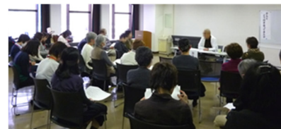
がん患者さんによるミニ講座を聞く参加者の皆さん

SAKURA は、がん患者さんとご家族が体験や悩みを分かち合い、よりよい日々を過ごせるよう支え合う場を提供するため、平成 25 年度墨田区在宅緩和ケア事業の一環として始まりました。3 年目の今年は、10 月 24、31 日、11 月 21 日（土）14 時～16 時にすみだ産業会館にて開催しました。この SAKURA は墨田区