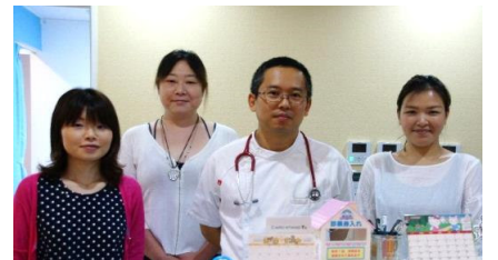
かわごえ小児科クリニック